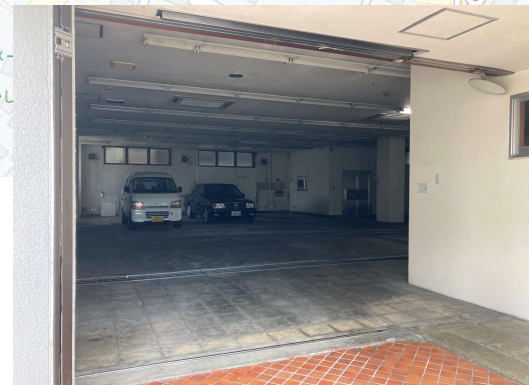
図面と現況が異なる場合は現況を優先させていただきます。