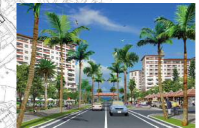
住宅地区内の主要道路沿道のイメージ