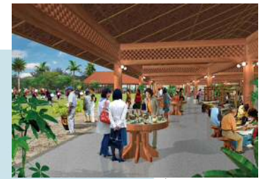
産業振興地区のにぎわいのイメージ