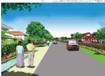
低層住宅地のイメージ