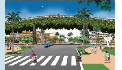
にぎわい交流軸交差点のイメージ