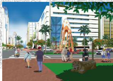
交通広場付近のイメージ