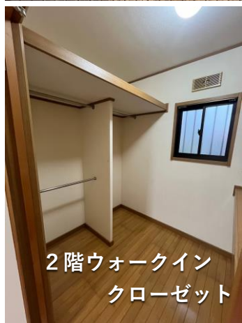
2階ウォークイン クローゼット