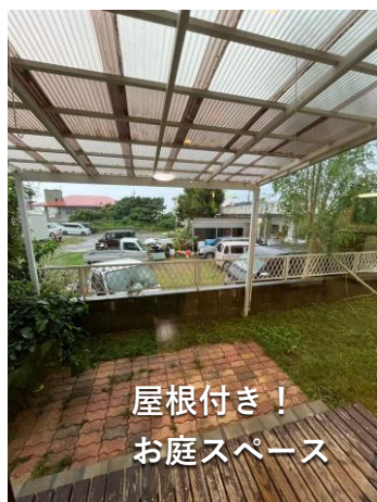
屋根付き！ お庭スペース