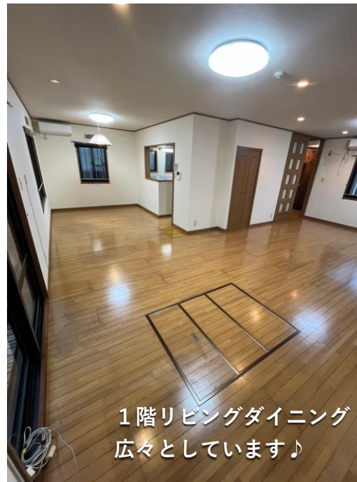
1階リビングダイニング 広々としています♪