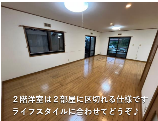
2階洋室は2部屋に区切れる仕様です ライフスタイルに合わせてどうぞ♪

室内、綺麗に保たれております！ 台風の多い沖縄には嬉しい 雨戸も去年に取替済です！ お庭に屋根付きスペースもあり、 きっとBBQも快適♪