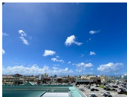
バルコニーから海が見えます♪