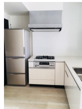
キッチン ※画像は別のお部屋の参考画像です