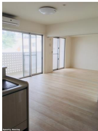
リビング ※画像は別のお部屋の参考画像です