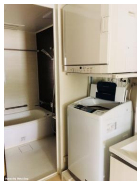
洗面室※画像は別のお部屋の参考画像です