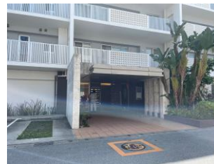
管理の行き届いたエントランス