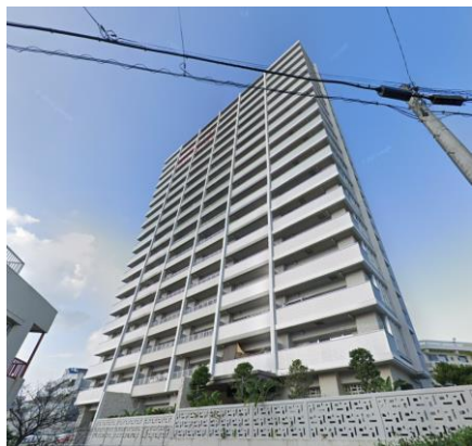
築浅できれいな外観