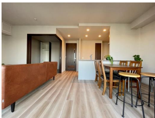
白を基調としたシンプルな内装

三原りうぼうまで徒歩5分 栄町りうぼうまで徒歩7分 タウンプラザかねひでと儀公園市場まで徒歩9分 栄町市場まで徒歩8分