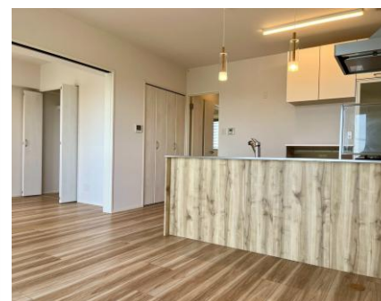
築浅で設備も綺麗です！