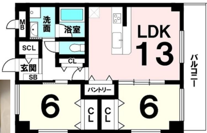
コンパクトでも使いやすい間取り！