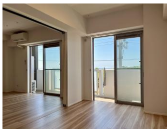
明るいいリビング